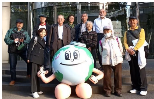
11月16日定例会(水部会) 有明虹の下水道館にて