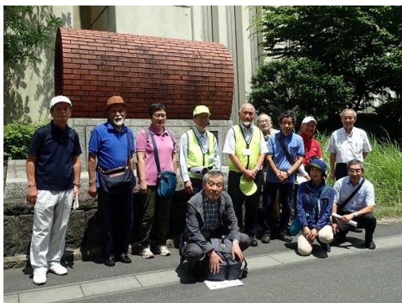
定例会「森ヶ崎水再生センター見学」(6/13)