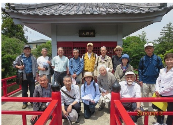
定例会「烏山川源流と寺町散策」高源院鴨池（5/12）