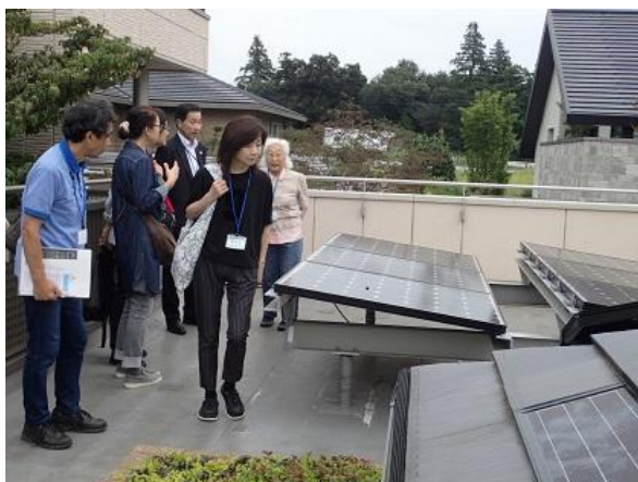
ゼロエネルギー住宅見学 (9/16) 様々な太陽光発電