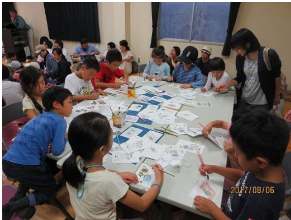
エコアップ探検隊夏編（8/6）セミの塗り絵の様