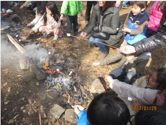
エコアップ探検隊冬編（1/29） 残り火でマシュマロ焼き